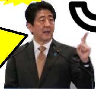
新たな開発目標の時代とUHC国際会議でスピーチする安倍総理大臣

~安倍首相スピーチ~ 「新たな開発目標の時代とUHC: 強靱で持続可能な保健システムの構築を目指して」 世界が直面している保健課題は、公衆衛生危機への対応の強化と母子保健や栄養不足から、非感染性疾病や高齢化まで、多様な課題に対応できる、生涯を通じた 保健サービスの確保 です。これらの課題に共通した取組として、私は、保健システムを、 強靱で持続可能かつ包摂的なものに強化していくべき と考えます。世界全体で、強い政治的意思、明確な計画、 十分な資金 、人材の動員が不可欠です。 (2015/12/16)